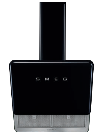
variante con kit camino (optional acquistabile separatamente)