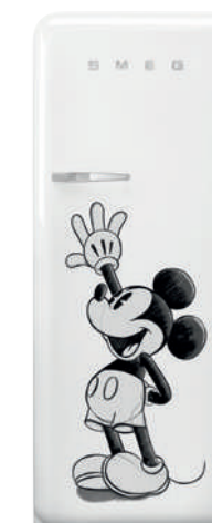
Mickey Mouse FAB28RDMM4