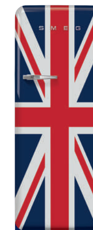
Union Jack FAB28RUJ3