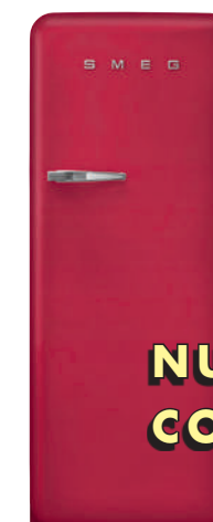
Ruby Red FAB28RDRB3