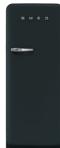
Black Velvet FAB28RDBLV3

Classe energetica A+++ Rumorosità: 38 dB(A) Consumo annuo di energia: 139 kWh Capacità di congelamento: 2 Kg/24h Autonomia di conservazione senza energia elettrica: 12 h Dimensioni: HxLxP 153x60,1x72,8 cm