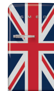
Union Jack FAB1ORDUJ2