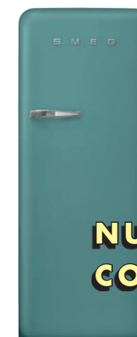
Emerald Green FAB28RDEG3